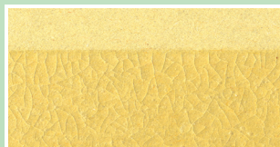
一般でん粉系接着剤