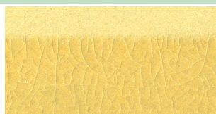
一般ボンド入接着剤