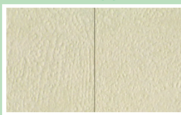
一般接着剤による施工例